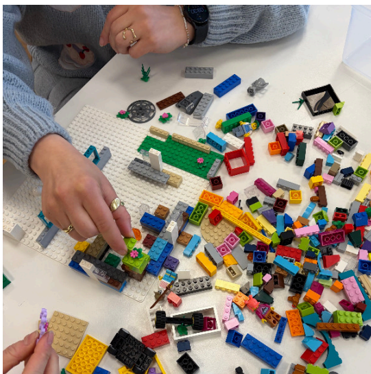
Hier entsteht gerade ein Modell einer idealen Schule auf einer LEGO® Platte.

Wie sieht eigentlich die „ perfekte Schule “ aus? Mit dieser Frage haben wir uns in den vergangenen Wochen in zwei Workshops gemeinsam mit Eltern beschäftigt, deren Kinder verschiedene weiterführende Schulen und Schulformen besuchen.