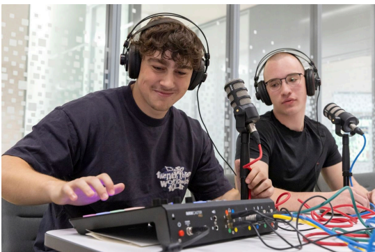
Schüler der BBS I bei der Aufnahme eines Podcasts