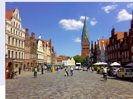
Quelle: Der Platz am Sande in der Hansestadt Lüneburg, Hansestadt Lüneburg, Daniel Ste