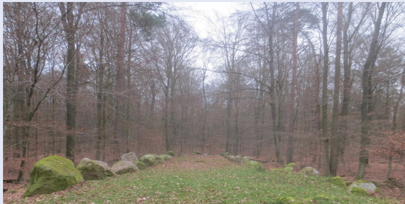
Kulturelles Sachgut von mindestens regionaler Bedeutung: Großsteingrab im Schieringer Forst