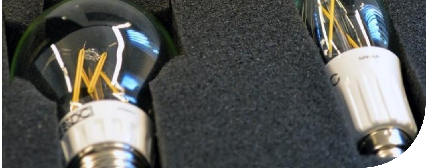
LED-Leuchtmittel im Glühlampendesign

Probieren Sie dimmbare LED-Leuchtmittel aus und verringern Sie ihren Energieverbrauch bei der Beleuchtung.